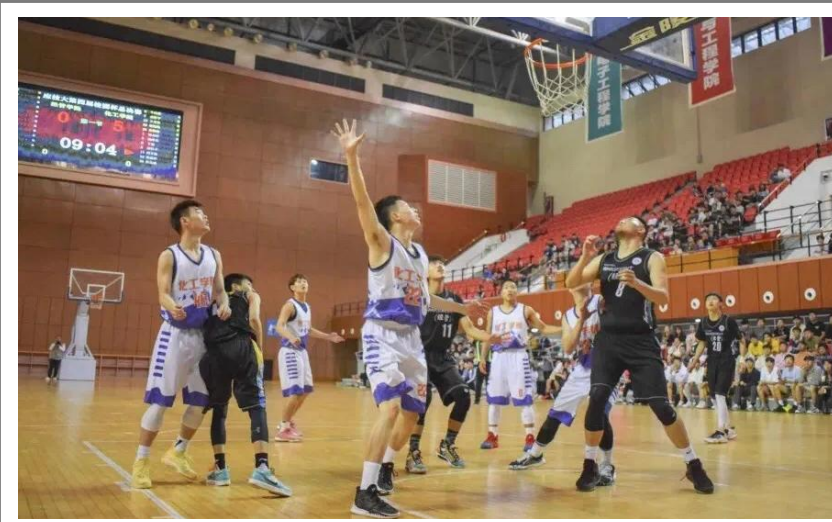
5月20日晚,作为我校传统体育赛事之一的“校园杯”篮球赛圆满落幕。经过激烈角逐,化工学院夺得本届篮球赛冠军,经管学院获亚军,城建学院和工创学院分获三、四名。